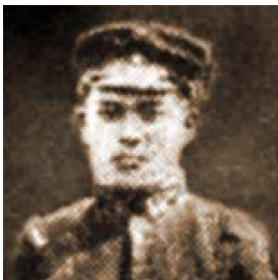
Morihei Ueshiba alors à l'infanterie (1904)

Morihei dut quitter Tokyo moins d'un an plus tard, après avoir contracté le béribéri. Il retourna dans sa ville natale de Tanabe où il finit par se rétablir complètement. L'expérience de Tokyo démontra qu'il n'était pas fait pour le commerce. Le Japon se préparant alors militairement au conflit avec la Russie, le jeune Morihei Ueshiba, épris d'aventure, s'engagea dans l'armée en 1903. Son don pour les arts martiaux se révéla en particulier lors des entraînements à la baïonnette au cours desquels il s'avéra être un des soldats les plus habiles.