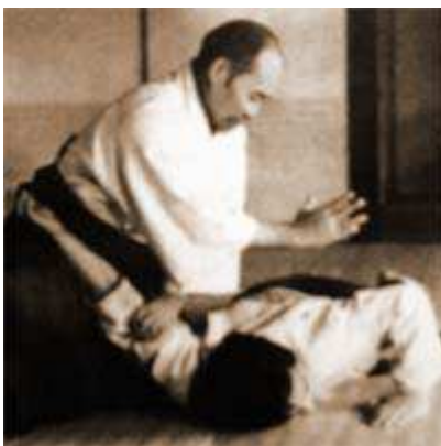
Morihei Ueshiba à Tokyo(Dojo Budorenshu)